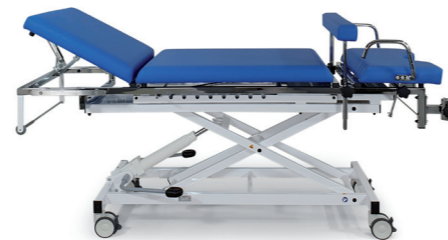
Modell 2640-01XL/H mit Ausstattungsoption: Papierrollenhalter (1265K), Normschiene (1410)