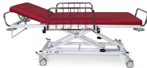
Modell 2220-00XL/H mit Ausstattungsoption: Entfall der serienmäßigen Seitensicherung, Seitensicherung abklappbar (2x1040), Papierrollenhalter (1267K), fahrbar auf zentral feststellbaren Doppelrollen (1180N), Schiebegriff-Ausführung verchromt; 64-708 cherry